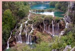
Foto-Show «Damals – Heute»: Eine Reise zu den schönsten Drehorten der legendären Winnetou-Filme